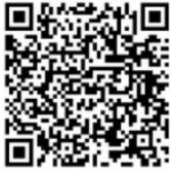
申込専用フォーム