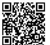
各店の詳細はHPから