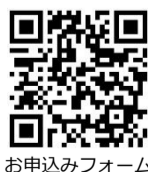
お申込みフォーム